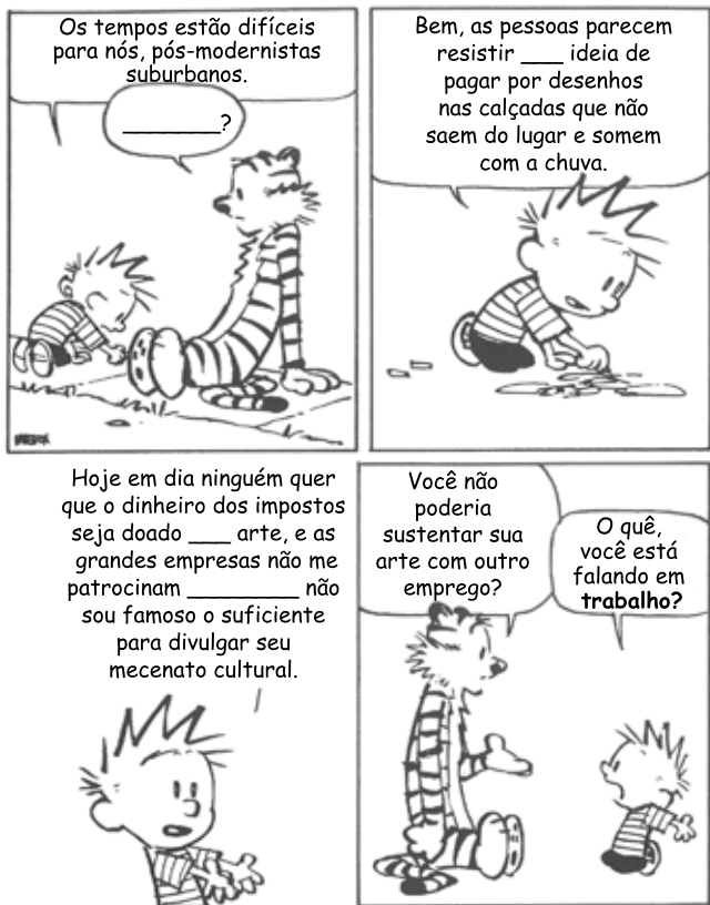
(Bill Watterson. O mundo é mágico: as aventuras de Calvin & Harold , 2007. Adaptado.)

Assinale a alternativa que preenche, correta e respectivamente, as lacunas da tira.