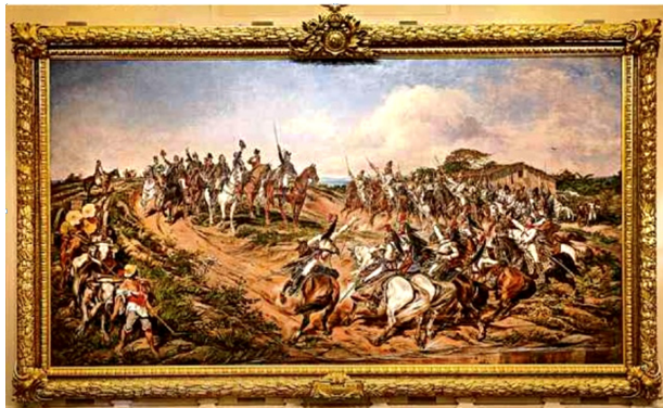
Independência ou Morte, de Pedro Américo (1888)