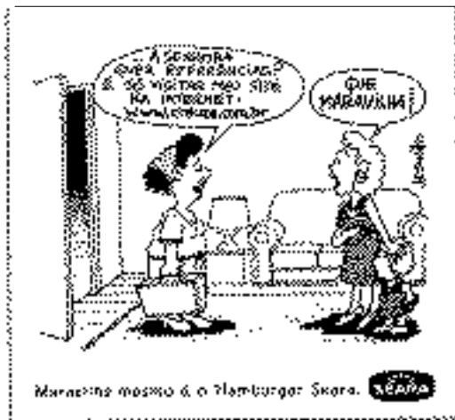
Folha de S.Paulo, 15/9/1997

7 - Como toda febre muda o comportamento das pessoas, a “tamagoshimania” criou polêmica.(...) Mas ainda é cedo para afirmar se eles são bons ou ruins para a gente. “Só após três ou quatro anos de convívio comum é que dá para fazer uma avaliação do efeito”, diz o psiquiatra Haim Grünsfun, que por muito tempo acompanhou a mania de Barbie. “Assim como a boneca, o